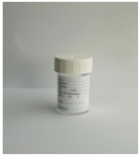
Flacon à urine du matin