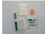
Matériel de prélèvement